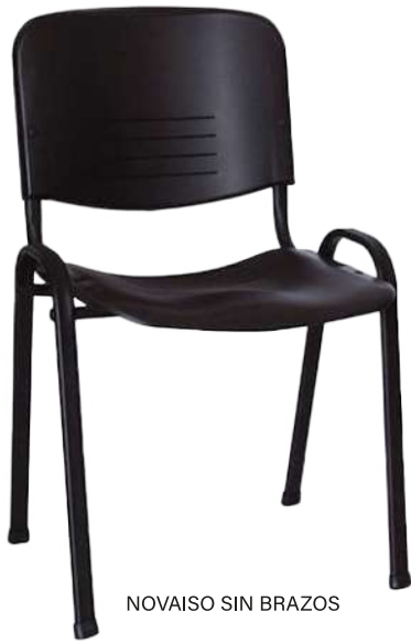
NOVAISO SIN BRAZOS