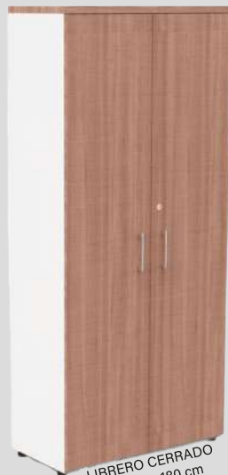
LIBRERO CERRADO 80 x 40 x 180 cm