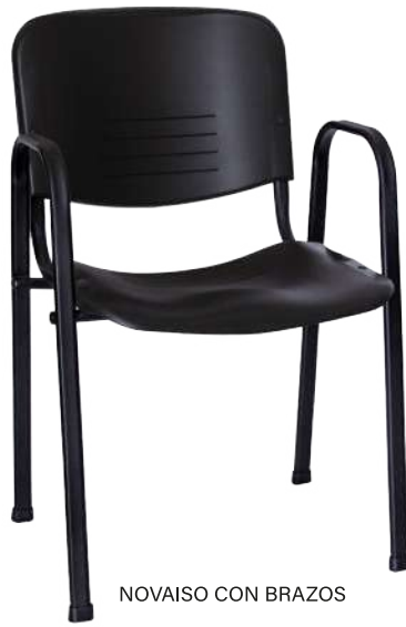
NOVAISO CON BRAZOS