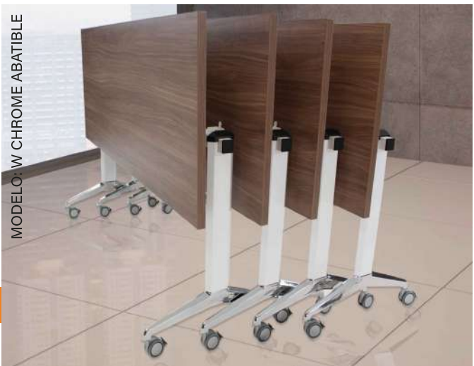
MODELO: W CHROME ABATIBLE