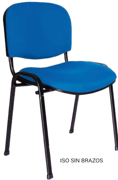
ISO SIN BRAZOS