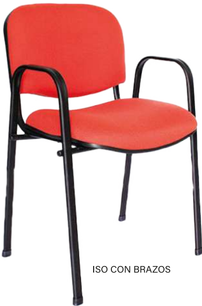
ISO CON BRAZOS