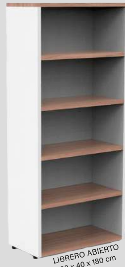
LIBRERO ABIERTO 80 x 40 x 180 cm