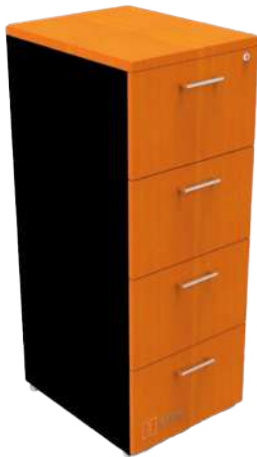
ARCHIVERO VERTICAL 4 GAV