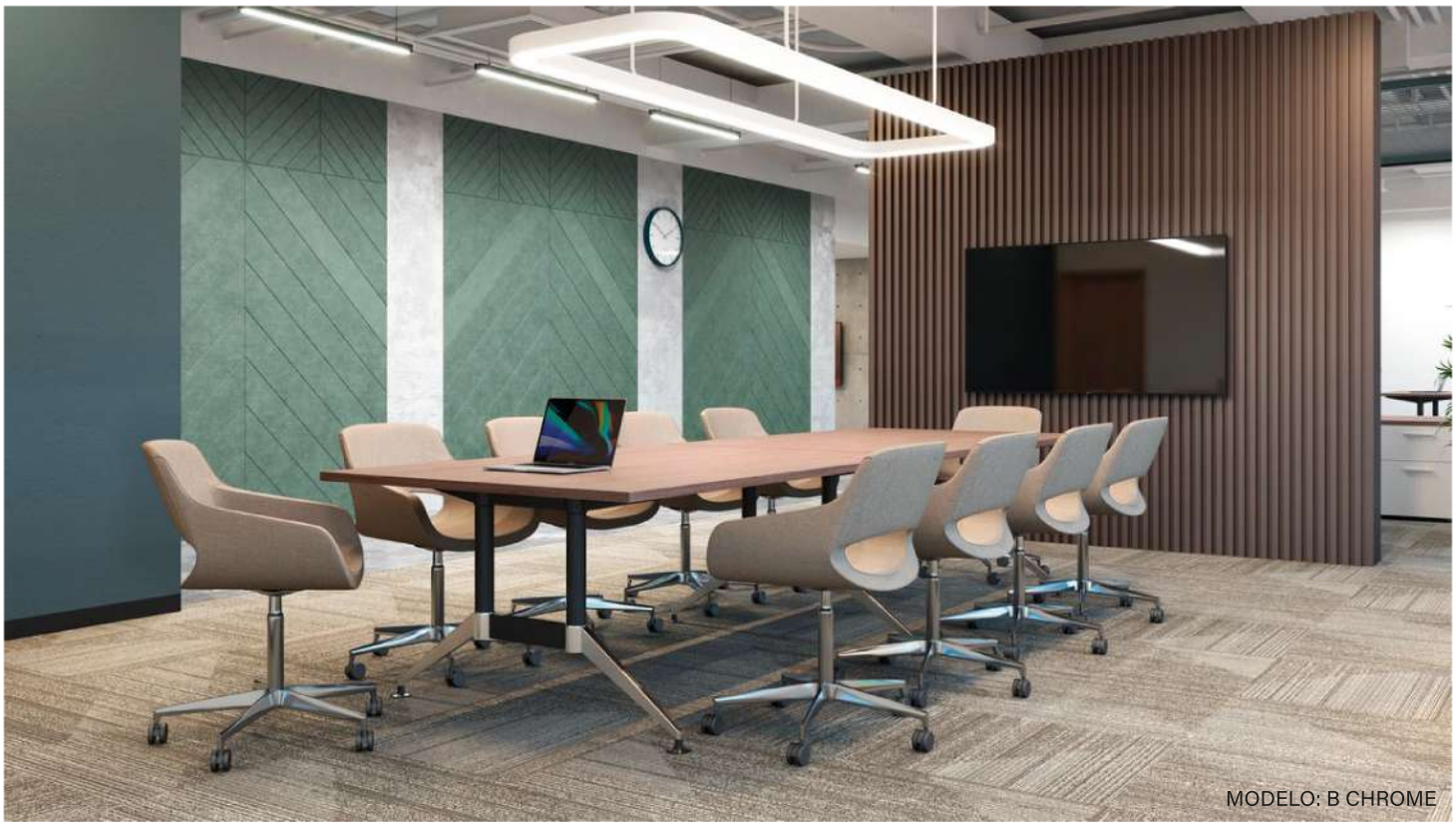
MODELO: B CHROME