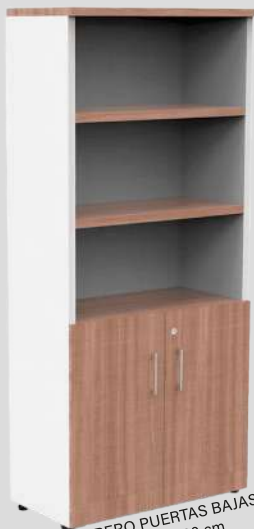
LIBRERO PUERTAS BAJAS 80 x 40 x 180 cm