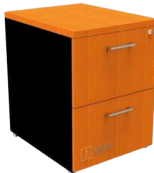
ARCHIVERO VERTICAL 2 GAV