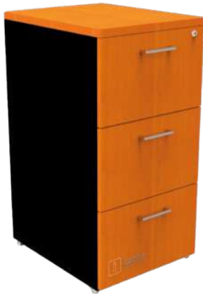
ARCHIVERO VERTICAL 3 GAV