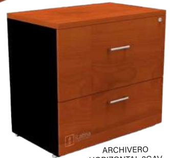
ARCHIVERO HORIZONTAL 2GAV