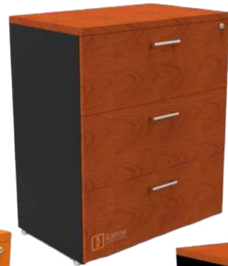
ARCHIVERO HORIZONTAL 3GAV